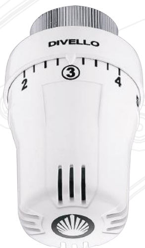
DIVELLO TOTAL THERMOSTAT M30X1.5 DV/IMI/HW

FULLSTÄNDIGT SORTIMENT AV TERMOSTATER OCH RADIATORVENTILER för en total balansering av värmesystemet. DIVELLO LIQUID H-TECH™ - termostater med vätskefyllt sensorelement för stabil rumstemperatur och hög stängkraft. Internal Blocking: omöjliggör manipulation av min- och maxtemperaturen. DIVELLO STATIC H-TECH™ - radiatorventiler med statisk och steglös förinställning som ger en bestående och exakt injustering samt säkerställer ett energieffektivt och problemfritt värmesystem med god värmekomfort.